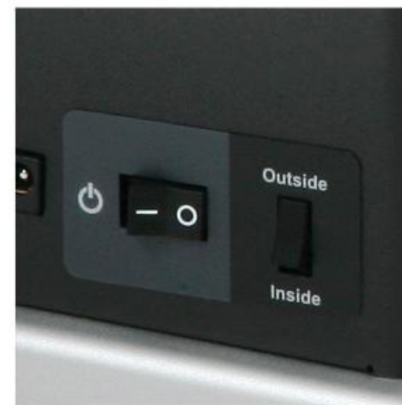
回捲方向開關 可切換內捲紙及外捲紙