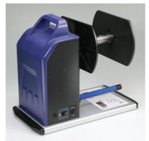
兼顧造型與實用性的外觀設計

邁多科技 www.LAAB.com.tw 02-2389-0101 04-2227-0088