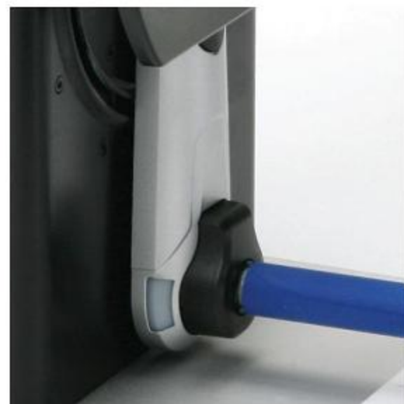
LED顯示燈號 可隨時顯示回捲機使用狀態