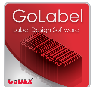
附贈標籤編輯軟體GoLabel 輕鬆製作及列印條碼標籤