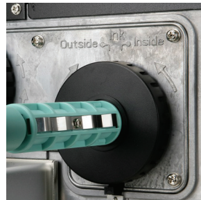
碳帶內外捲自動切換設計 安裝方便、使用簡單