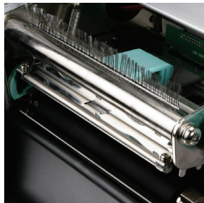
印字頭模組化設計 可輕鬆拆卸及換裝