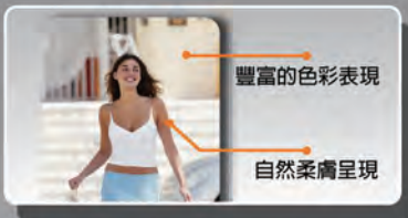
Photo Realistic Quality