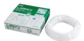
"N" TUBE UL224 Certification