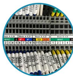
Terminal Block Marking Tape