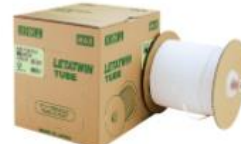
"L" TUBE Vinyl/Drum Roll