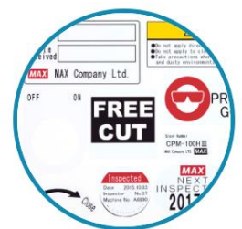
Any Size or Shape Labels