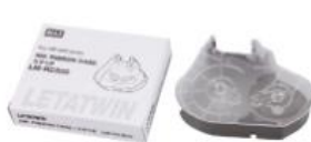
INK RIBBON CASE