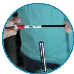
Heat Shrink Tube